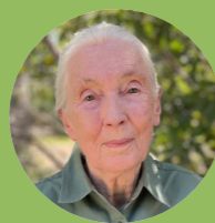
– DR. JANE GOODALL

‘It’s so important for young people to believe that they have the power to change the world.’