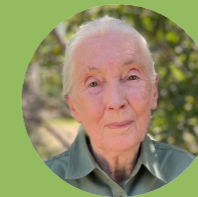
– DR. JANE GOODALL

‘Only if we understand, will we care. Only if we care, will we help. Only if we help we shall be saved.’