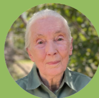
– DR. JANE GOODALL

‘What you do makes a difference, and you have to decide what kind of difference you want to make.’